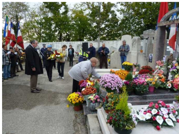
Dépôt de la gerbe