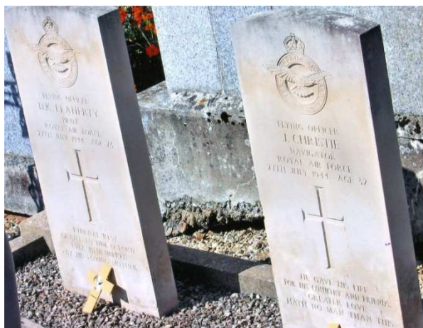
La tombe des aviateurs anglais