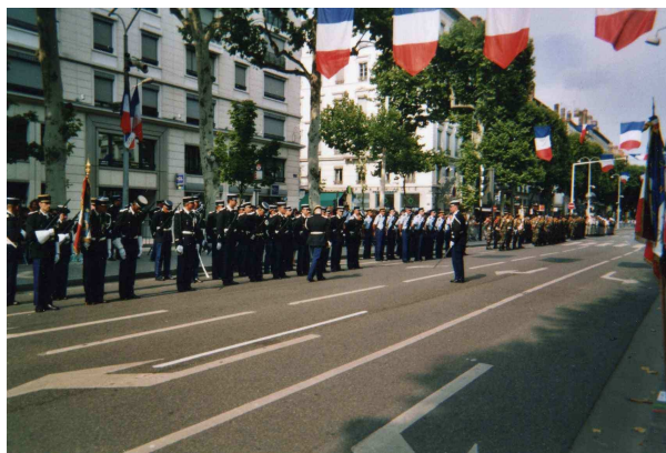
Le 14 juillet 2010