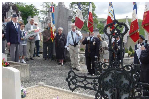
Pendant la minute de silence

Les hymnes nationaux Français et Anglais conclurent cette matinée du Souvenir toujours chargée d'émotion.