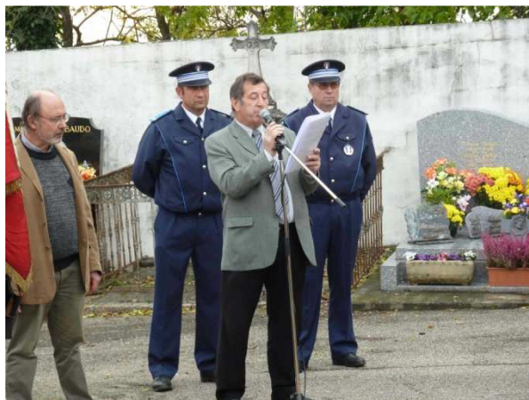
Allocution de Monsieur Guy AFFRE