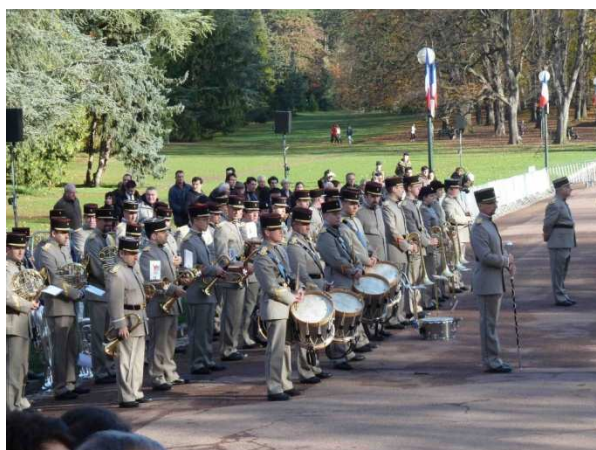
La musique militaire