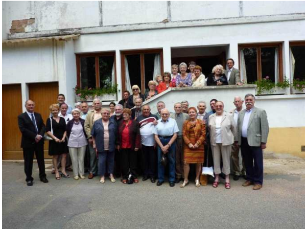
La photo de famille des participants