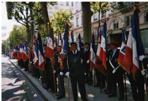
Les drapeaux place Tolozan à Lyon