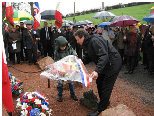
Dépôt de la gerbe