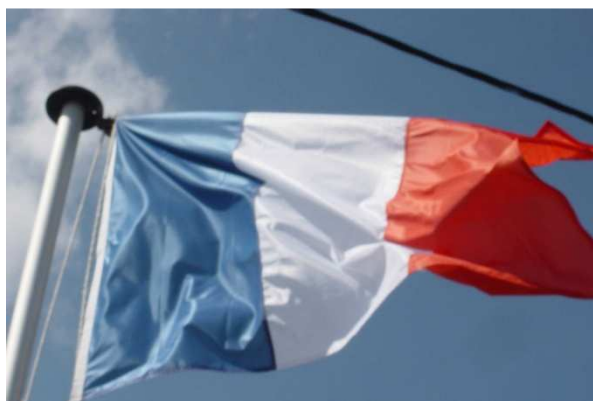
Le drapeau de l'Amicale au mémorial du Crêt