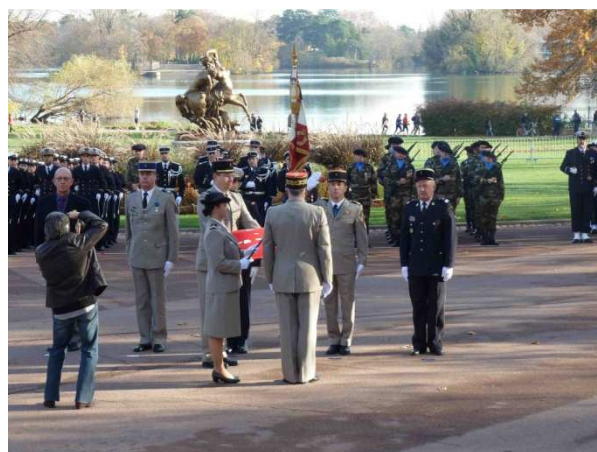
La remise des décorations