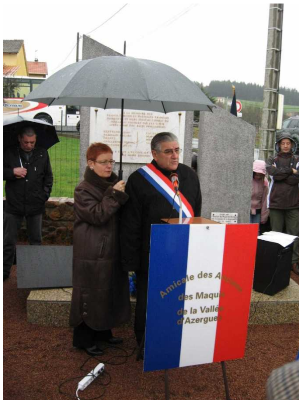
Monsieur FRECON, sénateur de la Loire