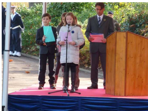
Les enfants de l'école Ste Marie des Brotteaux