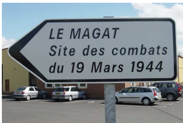
La nouvelle signalétique pour se rendre le site du Magat