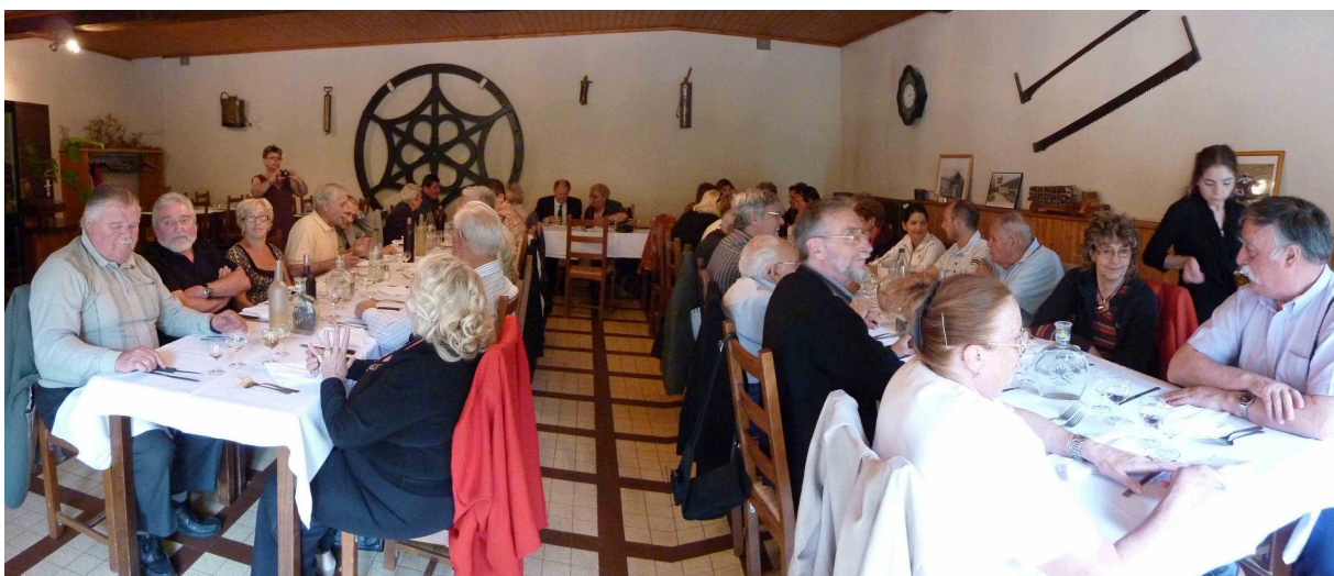
Le moment du repas