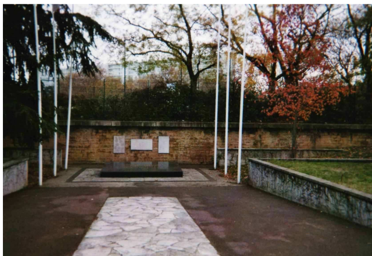
Le mur des fusillés de la Duchère

Les prises de parole des autorités nous rappelèrent les souffrances endurées par les peuples confrontés à la tragédie de la seconde guerre mondiale.