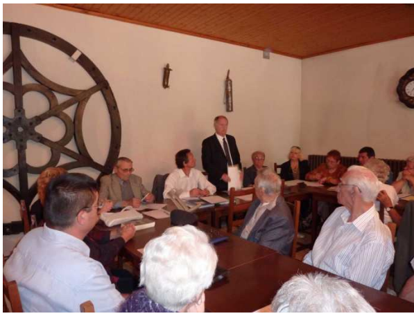
Ouverture de l'assemblée générale